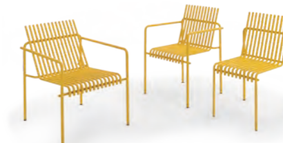
Sedia + sedia lounge AMALFI / AMALFI chair + lounge chair pag. 94