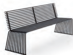
Panca con schienale / Bench with backrest pag. 57