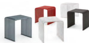
Cubo / Cube pag. 40