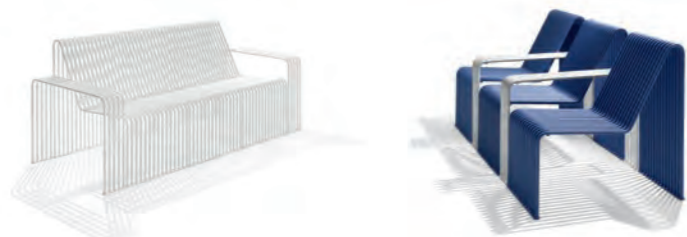
Divano / Sofa pag. 65