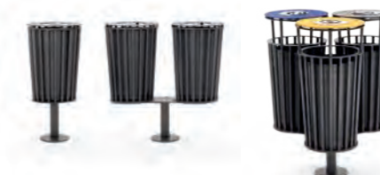
Cestini / Small litter bins pag. 108