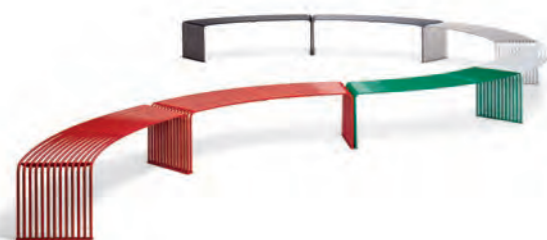
Panca piana concava o convessa / Concave or convex flat bench pag. 48