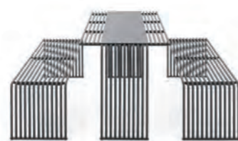
Tavolo / Table pag. 74