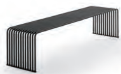
Panca piana / Flat bench pag. 43