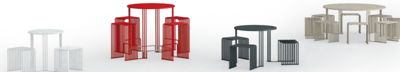
Tavolo picnic OCTOPUS / OCTOPUS picnic table pag. 78