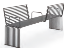
Accessori panca piana / Flat bench accessories pag. 46