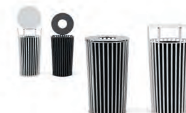
Cestoni / Big litter bins pag. 110