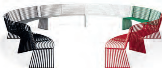
Panca con schienale concava o convessa / Concave or convex bench with backrest pag. 59