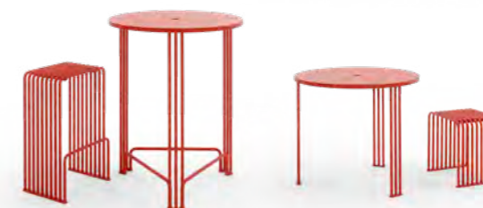
Componenti OCTOPUS / OCTOPUS components pag. 82