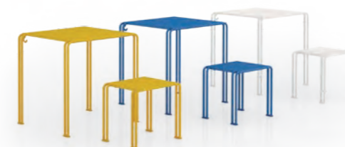
Collezione SCHOOL / SCHOOL collection pag. 92